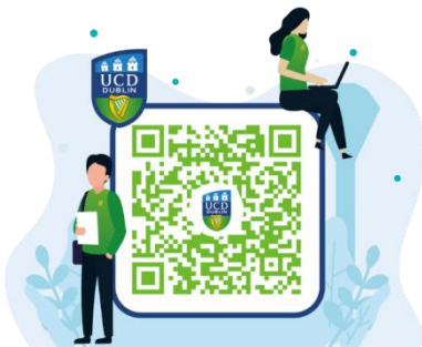
都柏林大学官方微信