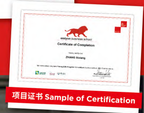
项目证书 Sample of Certification