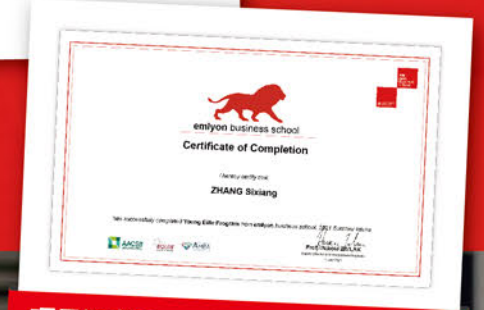
项目证书 Sample of Certification